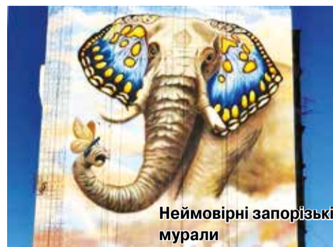
Неймовірні запорізькі мурали

Величний Дніпро, древня таємнича Хортиця, легендарні козацькі «Чайки», сяючі вогнями проспекти та площі, унікальні музеї, сучасний стріт-арт, коли звичайні багатоповерхівки перетворюються на справжні витвори мистецтва, – все це Запоріжжя. Нескінченний простір для