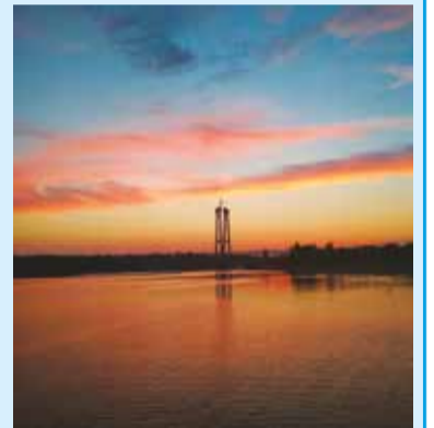
Вечір на Дніпрі