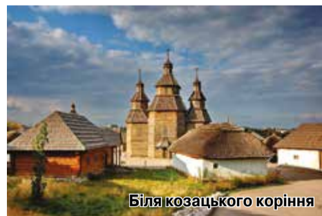
Біля козацького коріння

Крім «Фаєтону», у Запоріжжі можна цікаво провести час, завітавши до таких «перлин», як музей козацького флоту «Чайка», кінний театр, історико-культурний комплекс «Запорізька Січ», музей авіації «Мотор-Січ». А незабаром на нас очікує відкриття ще одного унікального для країни музею. В нашому Палаці буде створено Музей космонавтики.