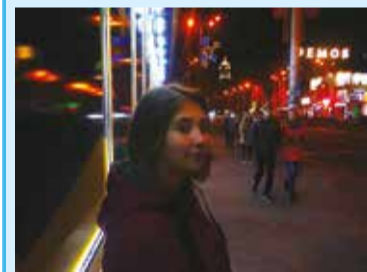
Прогулянка по проспекту Соборному